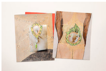
Navelportret 4 en 2.

In tegenstelling met wat U van mij gewend ben had U vorig jaar maar een, i.p.v. twee nieuwbrieven ontvangen. Dat komt omdat door Corona veel activiteiten gecancelld of verplaatst waren. Wel ben ik actief geweest op de digitale snelweg. Zo deed ik mee aan “We got your back” georganiseerd door Pictura Dordrecht en “Artist Support Pledge” op Instagram. Beiden bedoeld om de verkoop van kunstwerken te stimuleren. Mijn aandeel voor de kerstsale bij WG Kunst in Amsterdam was ook deze keer naast de reguliere tentoonstelling digitaal te bewonderen. Mijn bijdrage aan een mailart, georganiseerd door Hok gallery uit Den Haag heeft ook prachtige kunst opgeleverd.