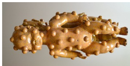
Kulit Langsep III

https://www.ateliersbacinol.nl/exposities/exposities-bacinol/expositie-galerie-arti-shock .